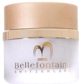
Омолаживающий дневной крем Rejuvenating Day Cream, Bellefontaine, 50 мл, 14 500 руб.