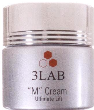
Лифтинг-крем «М» Cream, 3Lab, 12 000 руб.

ЭТИ КОСМЕТИЧЕСКИЕ СРЕДСТВА СРОДНИ НОВЫМ LAMBORGHINI. ВСЕ ДОСТИЖЕНИЯ СОВРЕМЕННОЙ ИНДУСТРИИ СОБРАНЫ В ОДНОМ ФЛАКОНЕ.