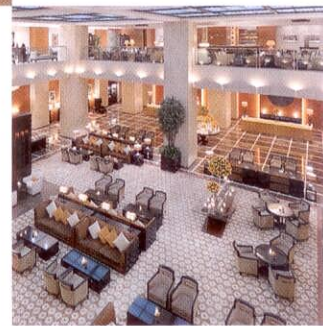
Холл отеля Grosvenor House

ОТЕЛЬ Grosvenor House находится на второй линии от моря (каждые 15 минут от дверей отеля до пляжа и обратно ходит бесплатный автобус), но вполне возможно, что за все время пребывания вам не захочется покидать его стены. Время можно провести более чем насыщенно – позагорать у открытого бассейна, затем пообедать в одном из баров или ресторанов отеля, например в индийском ресторане Indego by Vineet , кухней которого заведует мишленовский лауреат Винит Бхатия, а вечер провести в расслабленной атмосфере Buddha Bar . Можно даже успеть стать завсегдатаем B/Attitude Spa. Это огромный спа-центр с системой хаммамов, саун и пяти бассейнов-джакузи с постепенно меняющейся температурой воды, что оказывает положительное воздействие на организм. Здесь важно максимально использовать возможности спа-меню. Например, попробовать омолаживающий ритуал Body Caviar Rejuven' Active с использованием грязевого обертывания и теплого масла. Или процедуру для лица Bellefontaine Deep Hydrating Treatment , после которой кожа будет просто сиять. ♦