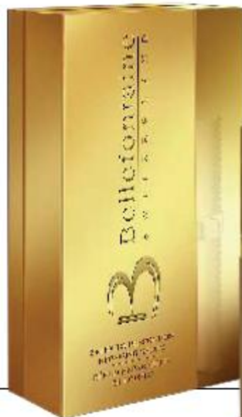
Масло для тела, BELLEFONTAINE

«Мои любимые средства Bellefontaine — восстанавливающая эмульсия после пребывания на солнце, омолаживающий дневной крем и восстанавливающая сыворотка для лица, а еще я люблю косметику марки Giorgio Armani»