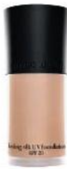
Тональный крем, Lasting Silk UV Foundation SPF 20, Lasting Silk UV Foundation, GIORGIO ARMANI COSMETICS