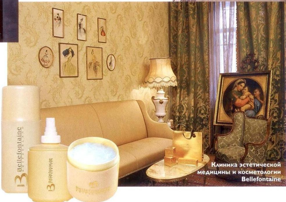
Клиника эстетической медицины и косметологии Bellefontaine

Благодаря этой процедуре действительно возможно в короткие сроки подтянуть, укрепить контуры тела, а также увлажнить кожу, придать ей здоровый и ухоженный вид. Состоит она из трех этапов. Пилинг с помощью скраба, нанесение сыворотки и крема «Совершенство контура», в ходе которого осуществляется моделирующий массаж, и обертывание проблемных зон с использованием коктейля из водорослей. Если в течение недели сделать три процедуры, эффект будет очевиден не только вам, но и окружающим.